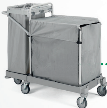
W719 + Sack M mit oberer Abdeckung und Reißverschluss