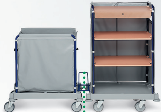
W819 + KM + Blaue Kupplung für Fahrgestell mit Rädern