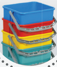
Eimer 4L (rot/gelb/ blau/gelb)

Aus leicht zu reinigendem und stabilem Kunststoff