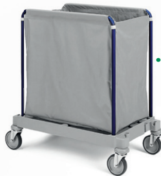
... W519 + Holm

Dank der durchdachten Produktauswahl von meiko haben Sie genau das zur Hand, was Sie brauchen. Eine große Auswahl an Reinigungswagen, passendem Zubehör und entsprechenden Produkten für die Oberflächen- und Bodenreinigung erleichtern das Arbeiten in Hotel und Gastronomie und gestalten es zeit- und kosteneffizient.